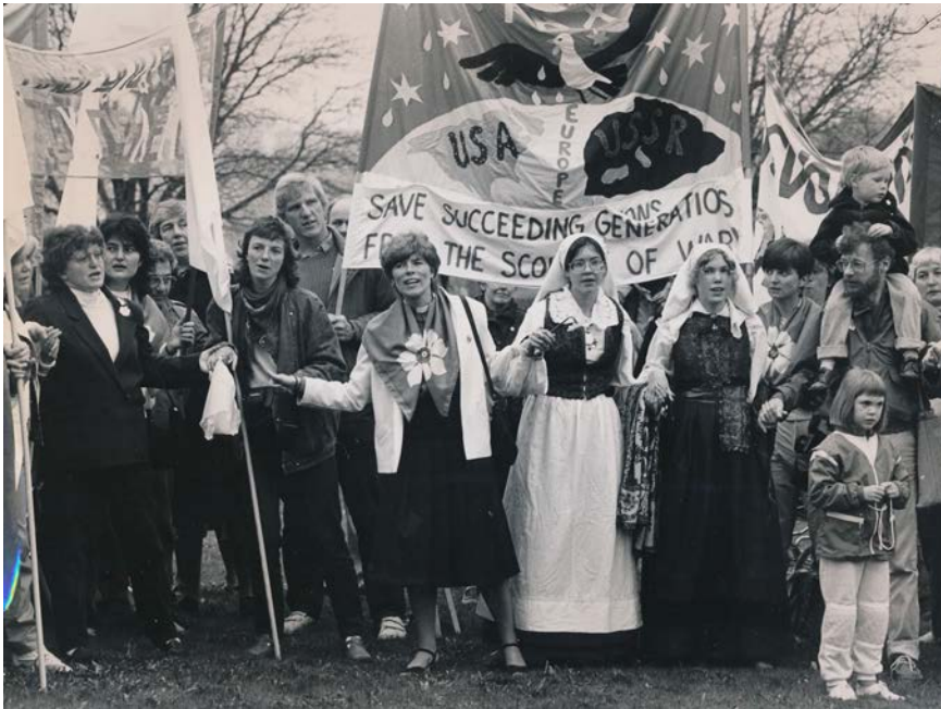
Avfärd Den stora fredresan, Ronneby.