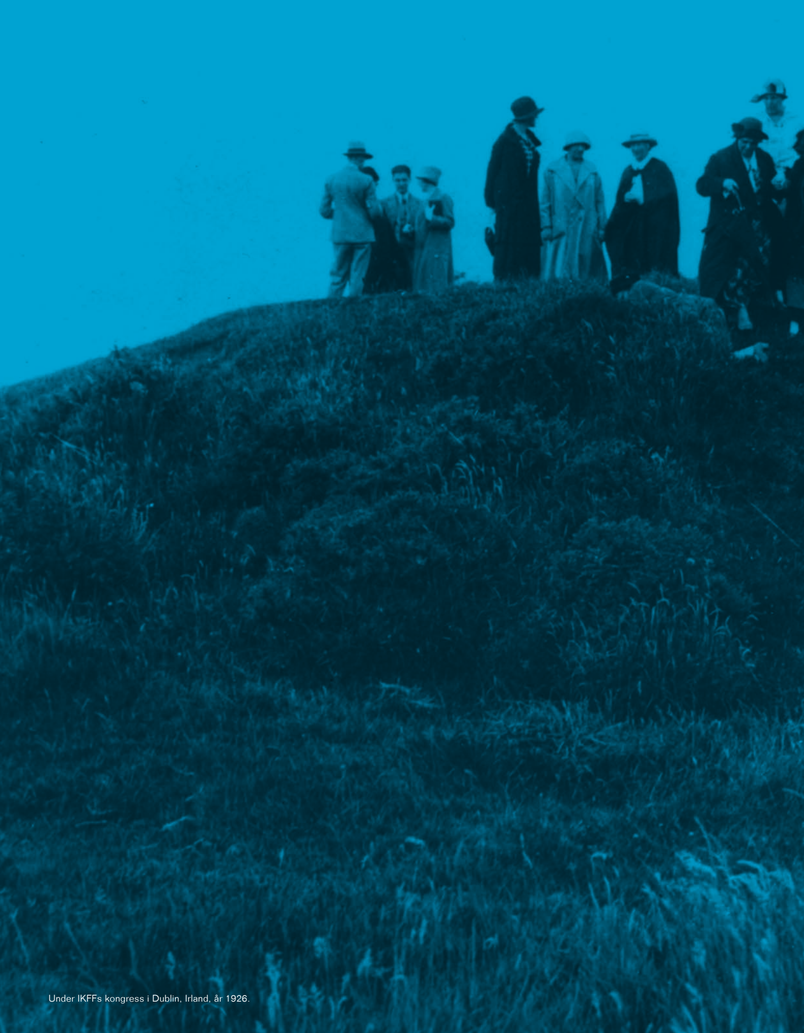
Under IKFFs kongress i Dublin, Irland, år 1926.